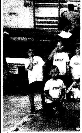
Do etapu powiatowego konkur